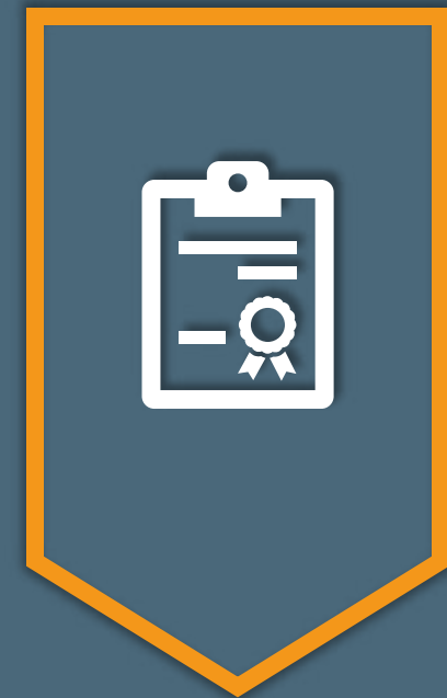
IT Richtlinien Dokumente