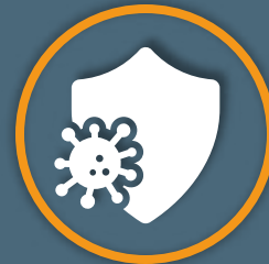
Virenschutz / Endpoint Protection