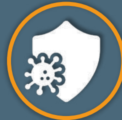
Virenschutz / Endpoint Protection